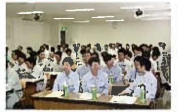
▲研修に参加した若手社員たち。休憩時間も積極的に講義の話を聞いていました。

建設労防の主催する現場代理人研修に若手社員8名が参加致しました。4月に入社した新入社員も含め、各自が安全についての理解を深める機会となりました。安全第一で施工を進めていくための考え方について講義があり、参加者は真剣に耳を傾けていました。これからも安全第一をモットーに、現場での工夫や改善に取り組めます。