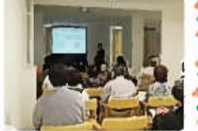
▲前回セミナーの様子。現地見学会好評。