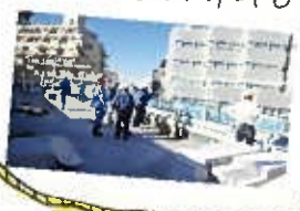
安全ピットロールの現場視察の様子

2019年12月4日(水)、建設業労働災害防止協会埼玉県支部川越分会による、工事現場安全ピットロールが実施され、川越市内にて当社が施工中の3つの現場においても視察が行われました。当日は現場事務所にて現場代理人へのヒアリングが行われた後、施工状況の説明をいたしました。12月1日~15日は「建設業年末年始労働災害防止強調期間」です。社員一人ひとりが安全に対する意識をさらに高め、本年も安全第一で各現場を進め、お客様に喜んでいただける建物づくりに努めます!