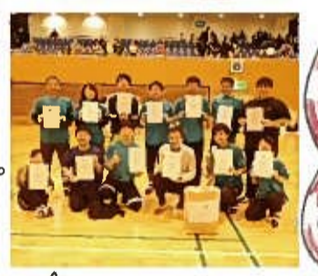
男女混合のチームで力を合わせて優勝しています

つば引き部では、地域の皆様との交流、地域貢献の一環として、地域で行われるさまざまな大会に出場しております。2019年11月3日(日)には川越市、12月1日(日)には鶴ヶ島市にて行われたつば引き大会に出場し、おかげさまでどちらも優勝することができました。また、それぞれ3連覇、2連覇を達成でき、大変嬉しく思います。つば引きは激しい場面もある競技ですが、大きな一体感・達成感の得られるもので、今年も楽しみながら活動を継続し、地域とのつば引きを大切にしたいです。