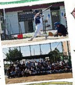
後日、相手チームの皆様から色紙の寄せ書きをいただきました!

2019年10月5日(土)、当社が採用活動中にお世話になっている協力会社の皆さんと、野球の交流試合を開催しました。両社合わせて50名ほどの参加があり、盛大に行われました。白熱した展開の中、結果は惜しくも敗れてしまいましたが、相手チームの若い力も感じられ、エネルギーに溢れた試合となりました。試合後は温泉入浴や川越散策を楽しみ、夜は懇親会も行いました。さまざまなシーンで両社の社員が情報交換をしたり、交流を深めたりと、素晴らしい時間を過ごすことができました。野球も仕事もチームワークが重要であると改めて感じられた一日でした。