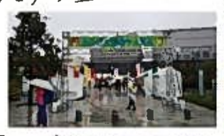
雨の中、たくさんのお客様が来場してくださいました!

2019年11月23日(土)・24日(日)、かわごえ産業フェスタに出展しました。2日間ご500名を超えたお客様に、当社の不動産・住宅・リフォーム・土地活用、各チームからご案内をさせていただきました。ご来場者様の中には、当社の管理物件にお住まいの方やオーナー様がおられたり、今後リフォームをお考えの方がいらしゃったりと大変盛況でした。今後も地域密着の会社として、こうした取り組みを継続してまいります。ご来場いただいた皆様、ありがとうございました!