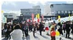
▲開催当日の様子。 多くの方にご来場いただき、大盛況の2日間でした。