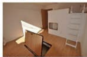
▲建物外観とモテビル室内