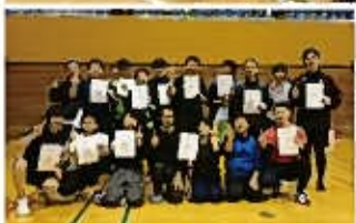
▲大会当日の様子。 (川越運動公園にて)