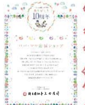
▲いただいた感謝状。

川木建設では、「1031ママ応援ショップ」優待カードのご呈示でエコバックを差し上げております。ご来店の際は、優待制度をぜひご利用ください。