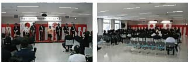
▲給食センター外観と開所式典の様子。

2017年8月26日(土)、「川越市立菅間第二学校給食センター」の開所式典が開催されました。この給食センターは、川越市のPFI事業(民間の資金と経営能力・技術力を活用し、公共施設等の設計・建設や管理・運営を行う公共事業の手法)として進められ、川木建設も事業者の構成企業の一社として、施工に携わりました。当日は開所式典のほか、施設内の見学と実際に提供される給食の試食会も行われました。弊社社長をはじめ社員も新たな門出に立ち会わせていただきました。