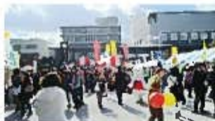
▲開催当日の様子。 多くの方にご来場いただき、大盛況の2日間でした。