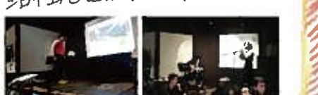
▲各部活動に対する報告の様子。

全社員参加の忘年会にて、各部の一年間の活動報告も行いました。2017年は部活動を通じた社内コミュニケーションが活性化された一年でした。