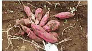
▲川越市内の農園にて。

「大黒会」は当社と協力会社からなる組織であり、ビジネスパートナーとしてお客様の喜びのために力を合わせて活動しております。本年も安全第一を胸に、お客様に喜んでいただける建物づくりを努めてまいりますので、よろしくお願い致します。